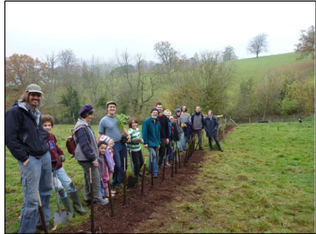
Vysazení živého plotu

Jsme nuceni řešit problematiku využívání země za účelem produkce zeleniny a současně podporovat druhovou rozmanitost planě rostoucích rostlin a volně žijících živočichů.